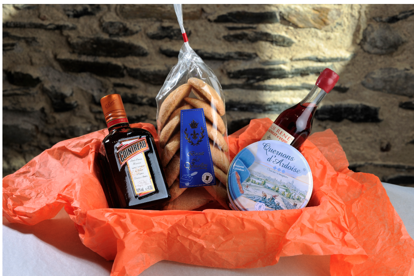
Les spécialités: Cointreau, Quernons, Guignolet, Vignonnais