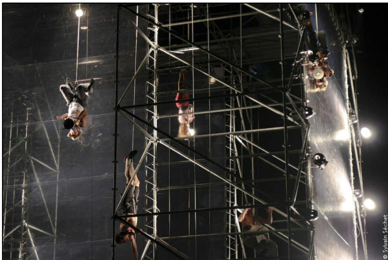
Festival Les Accroche-coeurs