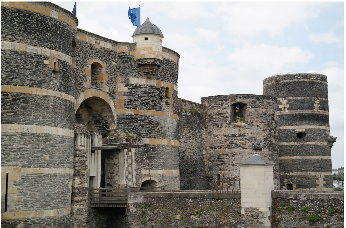
Le Château d'Angers