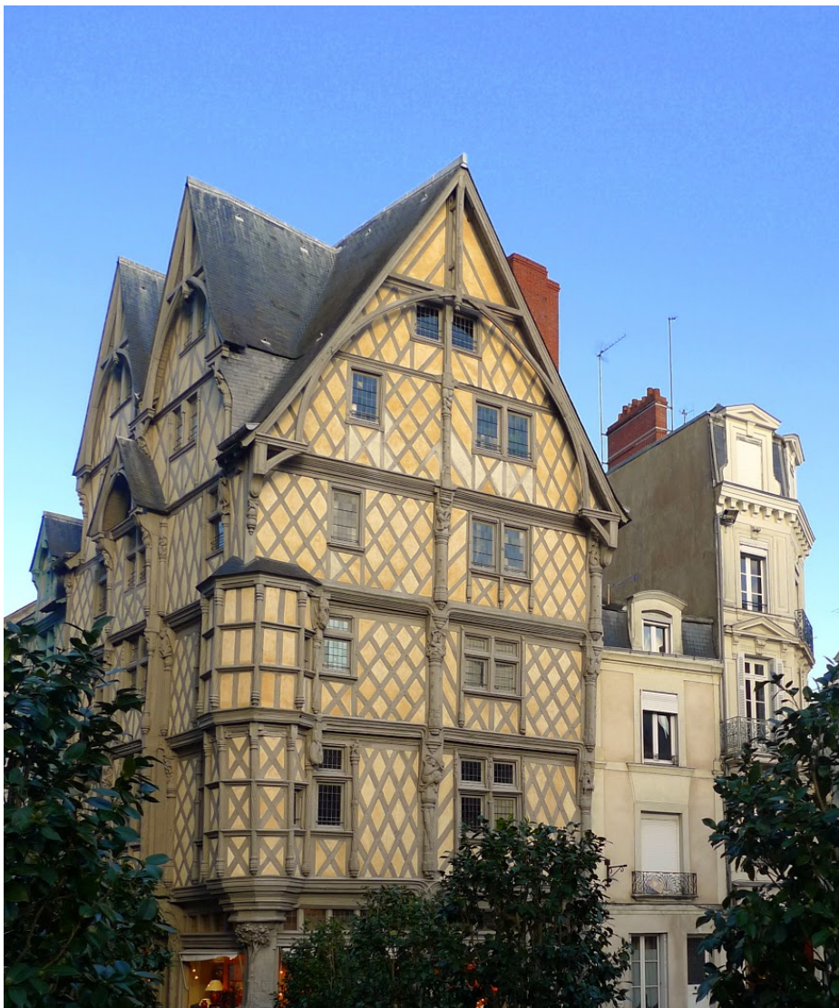
La Maison d'Adam (ou Maison des Artisans)