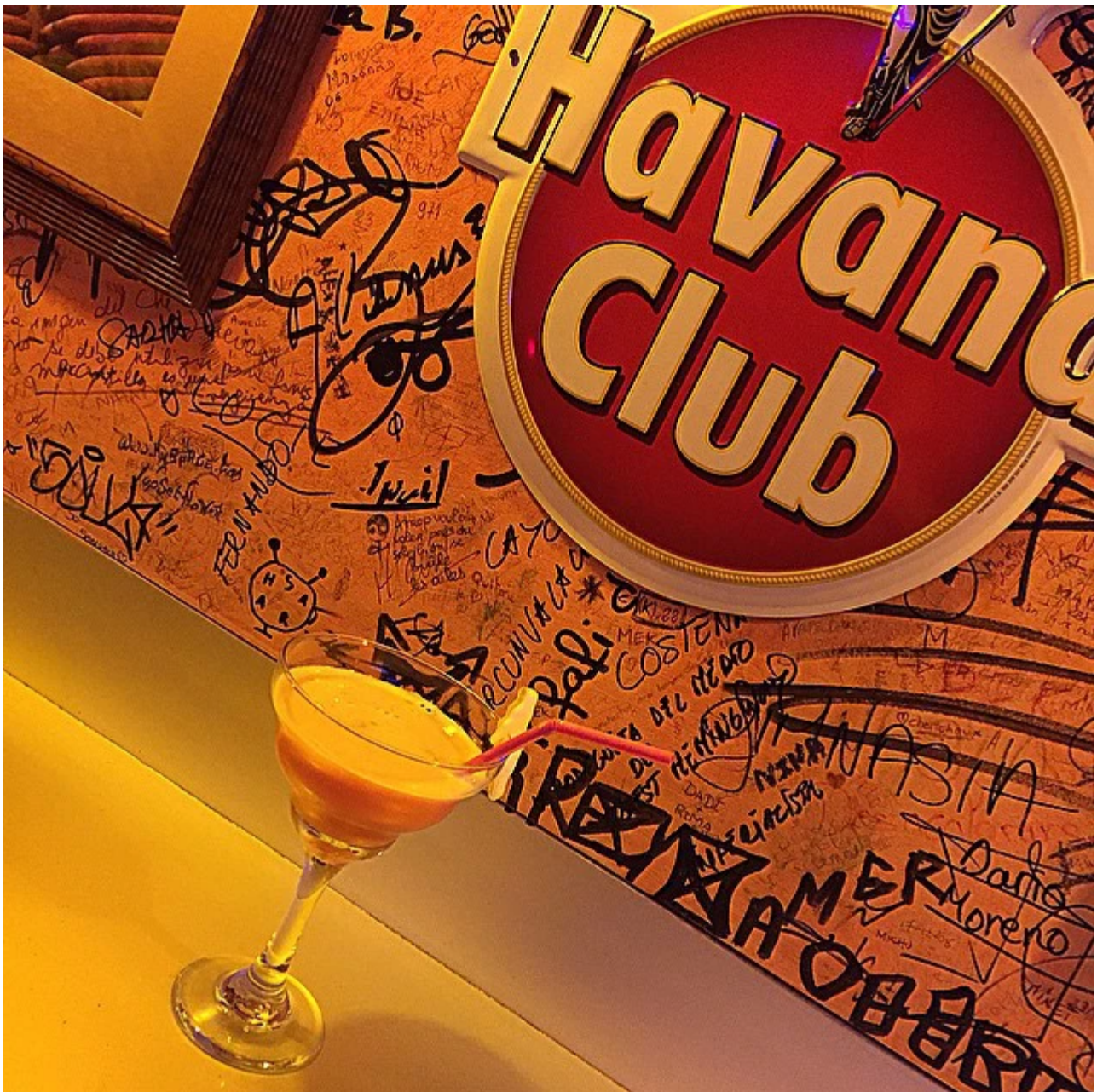
La Casa de Cuba