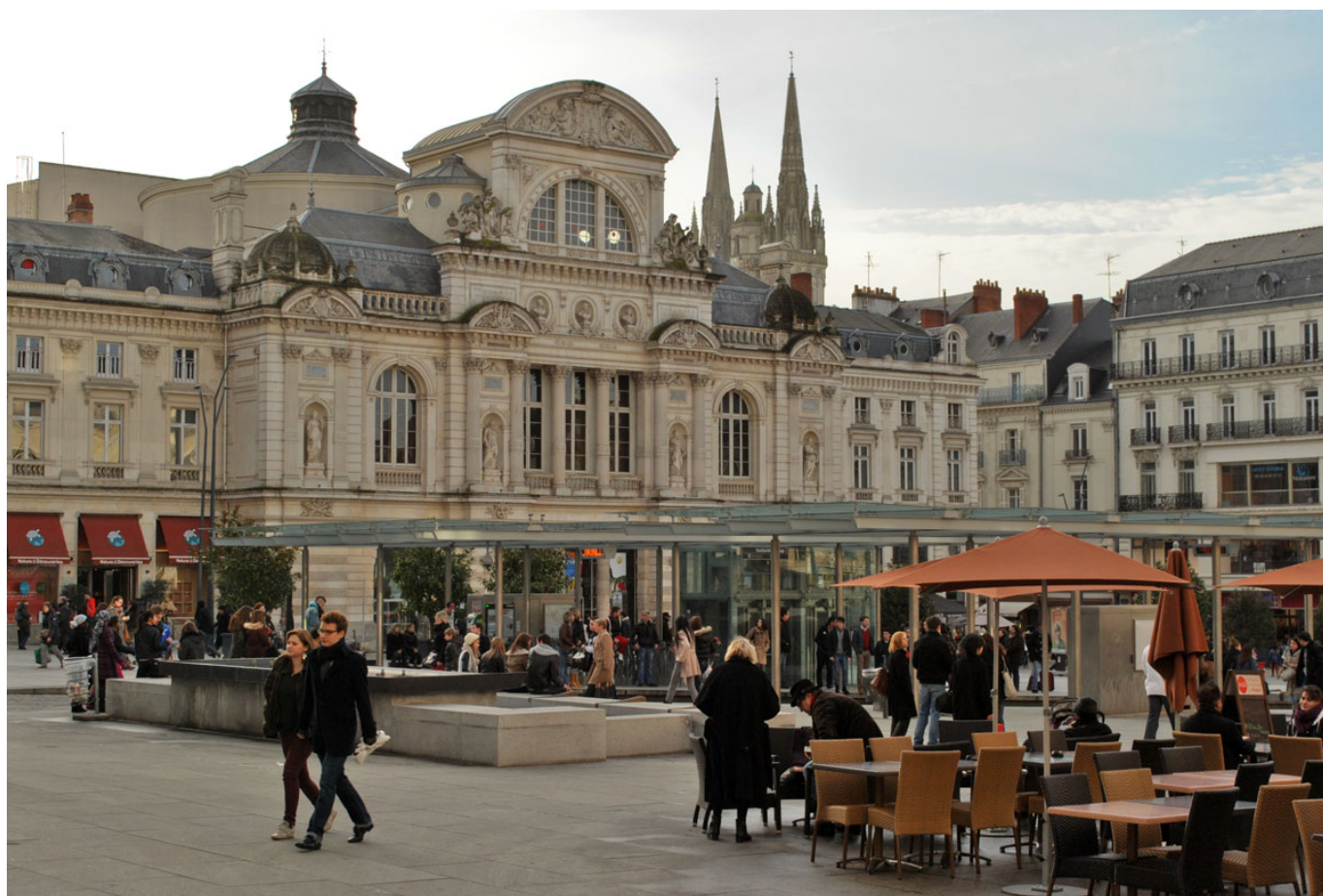
La Place du Ralliement et son théâtre