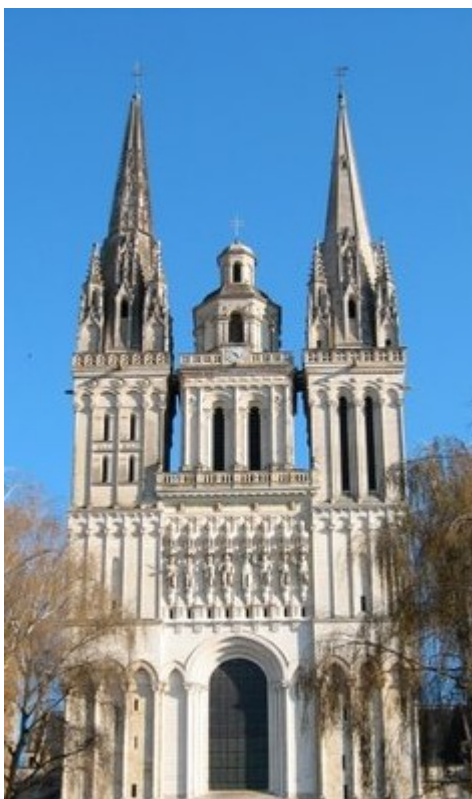
La Cathédrale Saint Maurice

Si malgré le soin que nous avons apporté à la rédaction de ce guide, vous constatez que des informations vous manquent ou que des liens sont inactifs, n'hésitez pas à nous en faire part sur le site de La COLOC ANGEVINE ou sur notre courriel contact@lacolocangevine.fr .